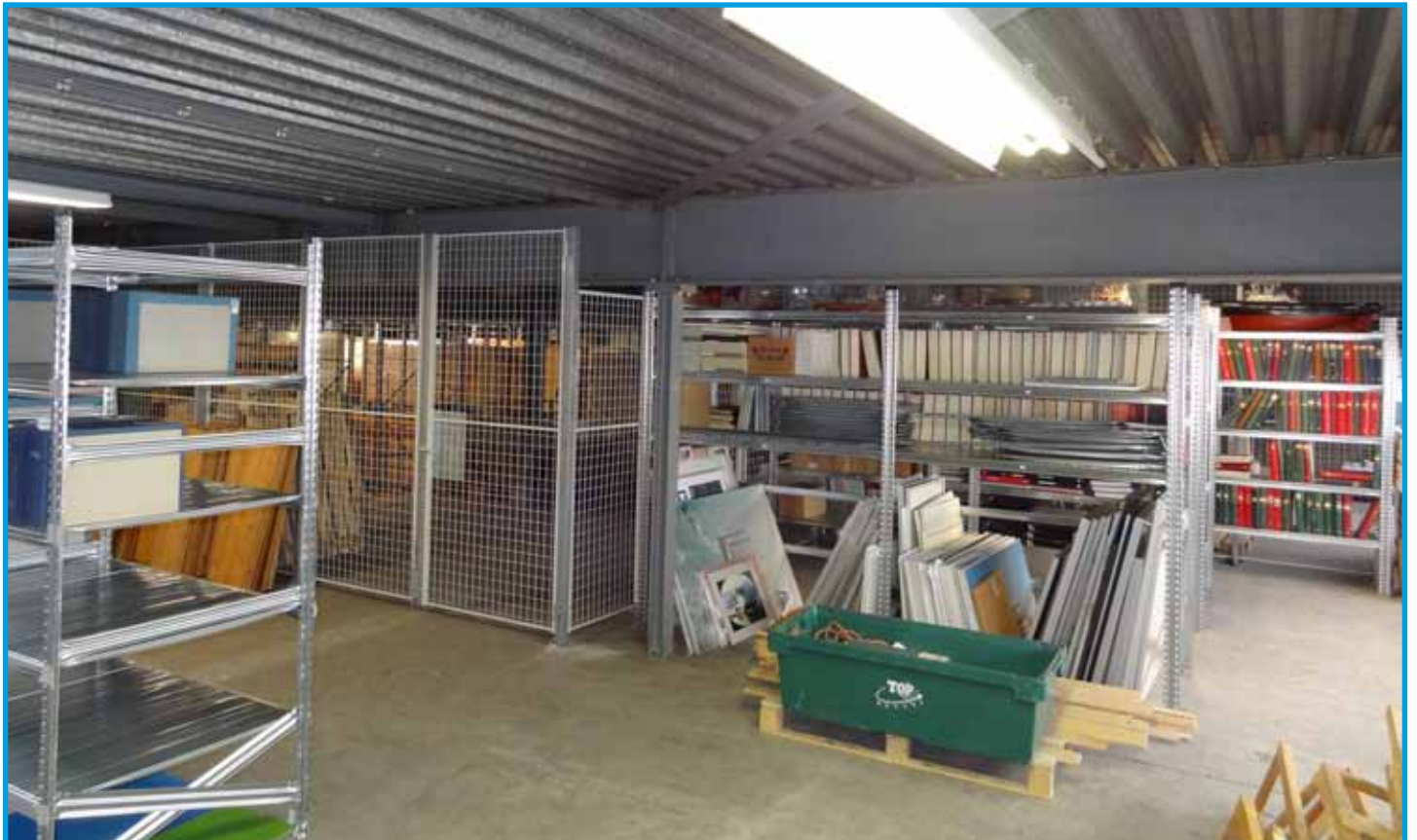
Boven de verhuisladderwagen in de Ankerstraat en onder het al gedeeltelijk ingerichte nieuwe archief bij de Dukdalfbedrijven