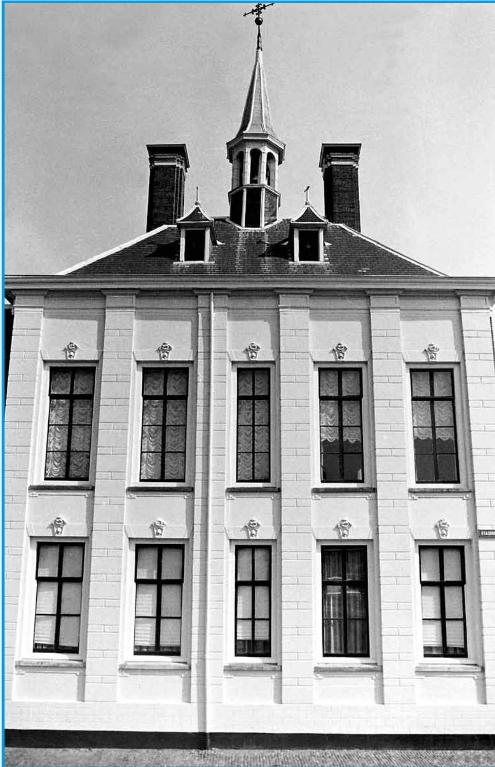
Het stadhuis toen het nog in functie was