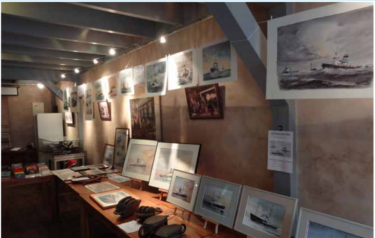
Met een presentatie in de Kuiperij