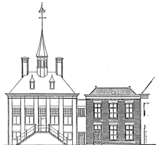
Voorgevel van het Stadhuis annex Sleepvaartmuseum met rechts het pand Hoogstraat 3.

Tijdens de opening van Hoogstraat 3 als vast onderdeel van het Museum werd tevens de tentoonstelling 'Thuishaven Maassluis' geopend. In de dertig daarop volgende jaren werden de onderstaande tentoonstellingen samengesteld.