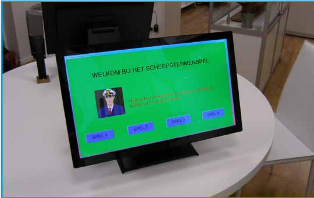
De spelcomputer in de Zee-zaal

Aan dezelfde tafel in de Zeezaal waarop het B.I.S. staat opgesteld, hebben we ook een spelcomputer staan met daarop een spel voor de jeugd van 6 tot 80 jaar. Daarmee kan men de kennis van scheepstermen toetsen.