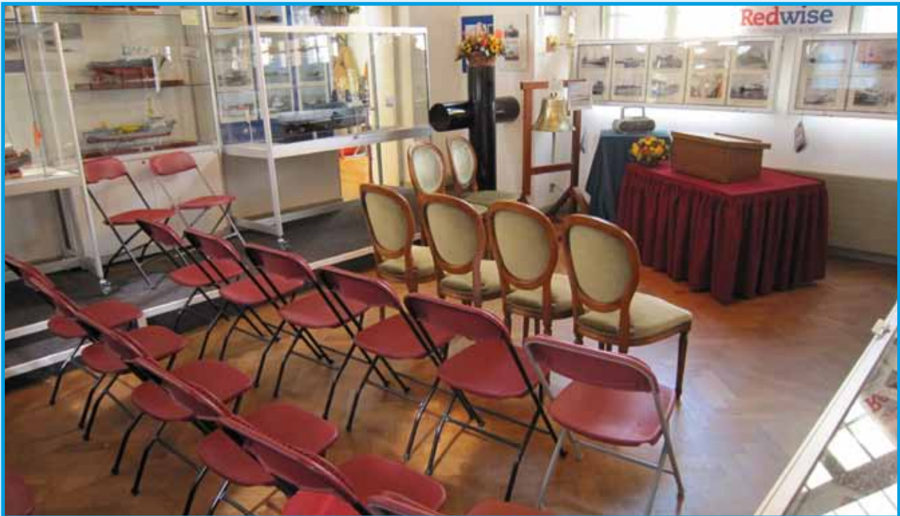
De wisseltentoonstellingszaal aangepast voor een trouwgelegenheid

Sinds 2010 kan er in het Museum ook weer getrouwd worden. Het voormalige stadhuis was in het verleden de trouwlocatie voor de Maassluise inwoners. Vele bruidsparen gaven destijds hier dan ook hun ja-woord en die mogelijkheid is nu weer aanwezig. De wisseltentoonstellingszaal kan op een eenvoudige manier omgebouwd worden en heeft dan een capaciteit van ongeveer 35 personen.