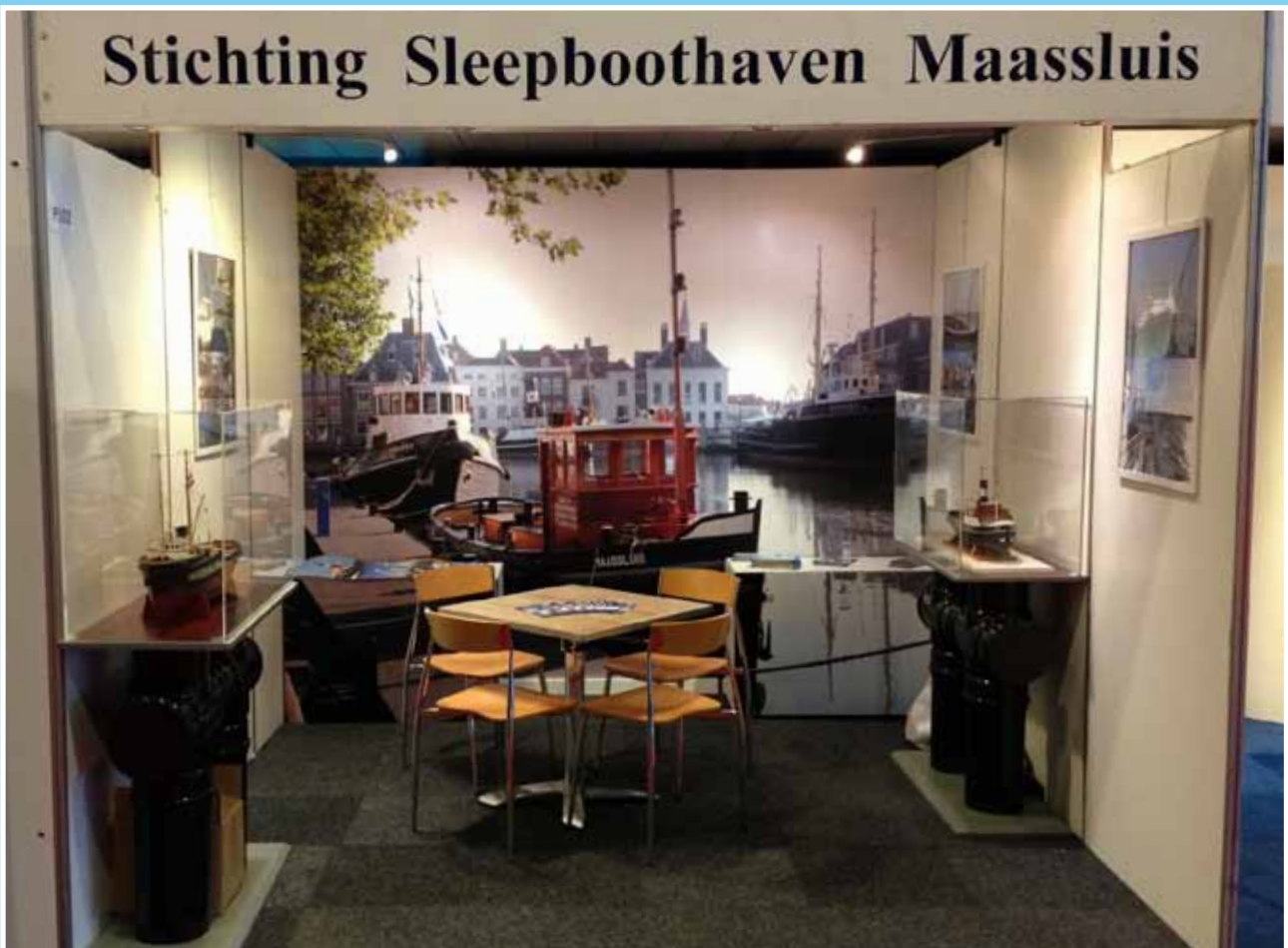
Ook op de jaarlijkse Europort Maritime zijn we aanwezig, mede als onderdeel van de Stichting Sleepboothaven Maassluis.