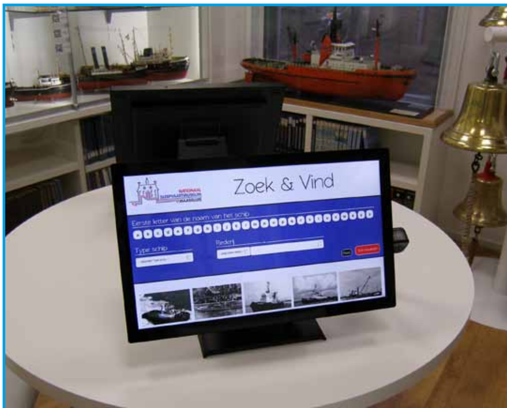
De opstelling in de Zeezaal

Om gegevens van sleepboten voor onze bezoekers gemakkelijk inzichtelijk te maken, hebben we een Bezoeker Informatie Systeem ontworpen. Hiermee kunnen gegevens en foto's van sleepboten worden opgevraagd. Het B.I.S. is voor de bezoekers te gebruiken in de Zeezaal. Daar staat een computer waarmee men in het systeem kan komen. De naam van het zoekprogramma is 'Zoek & Vind'. Door het invoeren van de naam van de sleepboot kan men de gegevens en foto's, terugvinden. Dit systeem zijn we nog aan het vervolmaken en mede gezien het grote aantal sleepbootgegevens die we in onze archieven hebben zal het nog wel enige tijd duren voordat alle informatie hierin verwerkt is.