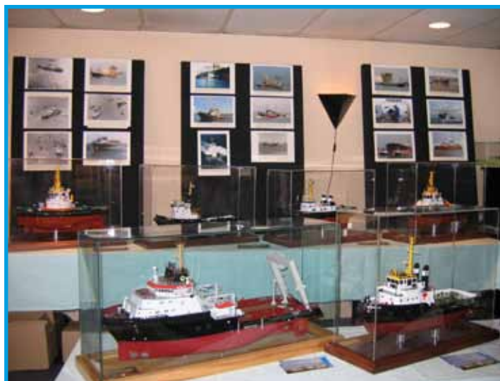
Paviljoen Westkant Terneuzen De opstelling in Paviljoen Westkant.

Tijdens de Wereldhavendagen in Rotterdam en de Furiade en de Sleepboothavendag in Maassluis is het Museum met een of meerdere kramen aanwezig. Doel is bekendheid te geven aan ons Museum en tevens om diverse nautische artikelen en -boeken te verkopen, om zo de financiën op peil te kunnen houden. Ook hopen we op deze dagen contact te kunnen leggen met eventuele nieuwe vrijwilligers voor ons museum.