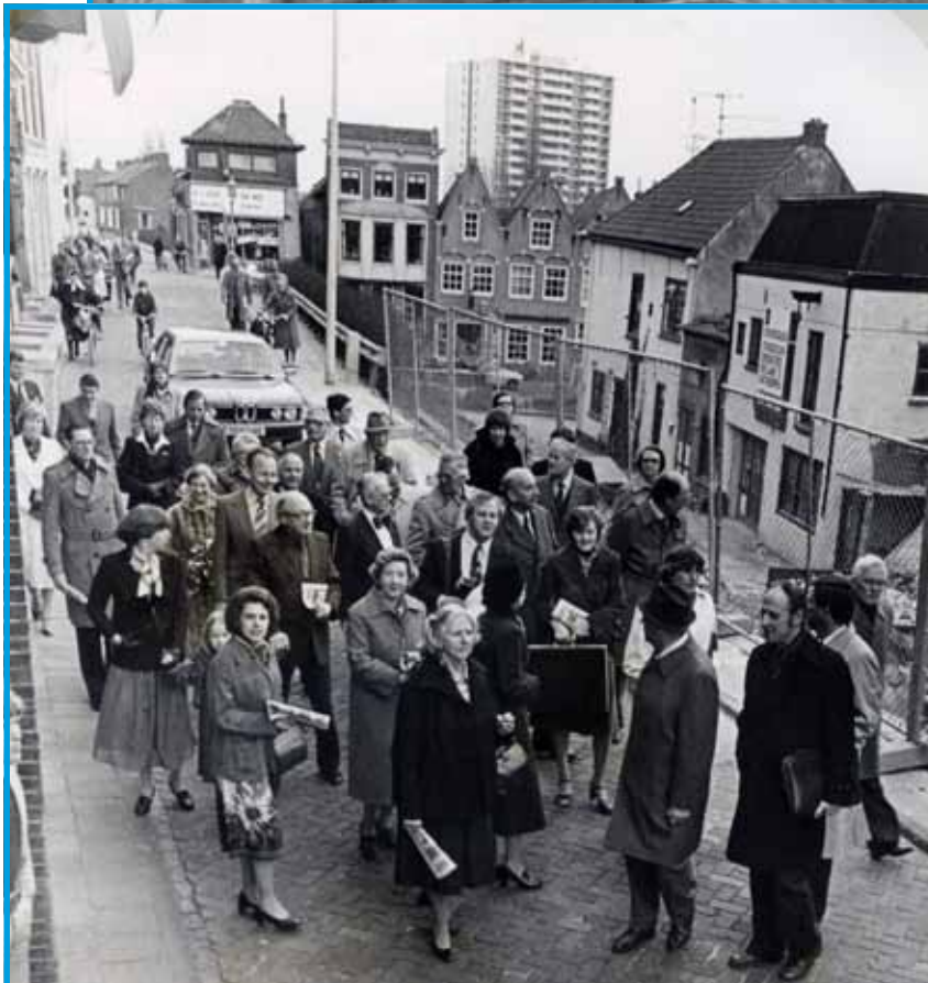
Het Nationaal Sleepvaart Museum werd op 18 april 1979 geopend. Daaraan voorafgaand was er voor de genodigden een samenkomst in de Grote Kerk van Maassluis, waarna men naar het Museum liep voor de officiële opening.