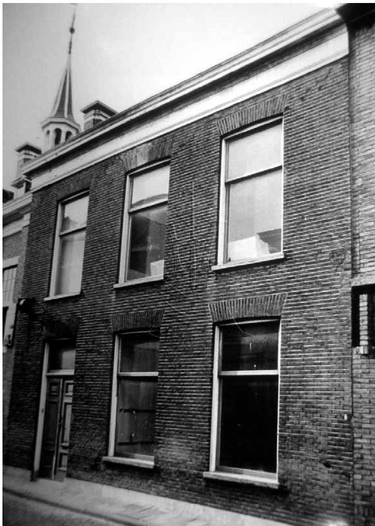
Het pand Hoogstraat 3

Bij de opening van het Museum werd al gesteld dat de expositieruimte vrij krap was. Reeds in 1980 waren er al ideeën om het Museum elders voor te zetten i.v.m. het gebrek aan expositieruimte. Er werd gedacht aan het gebouw van Loodswezen op het Schanshoofd. Een ander alternatief was het naast het Museum gelegen pand Hoogstraat 3. De kosten van dit pand, zowel in aanschaf als huur, waren echter dermate hoog dat dit niet haalbaar zou zijn voor de Stichting Nationaal Sleepvaart Museum.