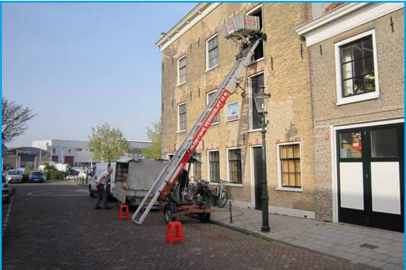
Boven de nog lege, nieuw in gebruik te nemen archiefruimte en onder de verhuisladderwagen in de Ankerstraat