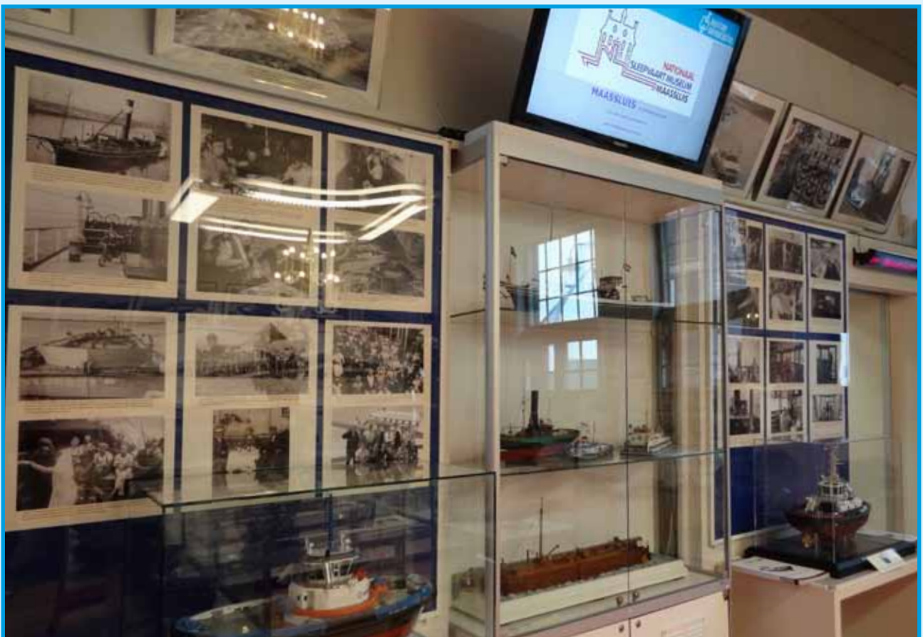
De oude opstelling aan de muur tussen Hoogstraat 1 en 3 en de nieuwe opstelling, met de vitrinekast en het daarboven geplaatste TV-scherm en de blauwe fotoborden aan beide kanten