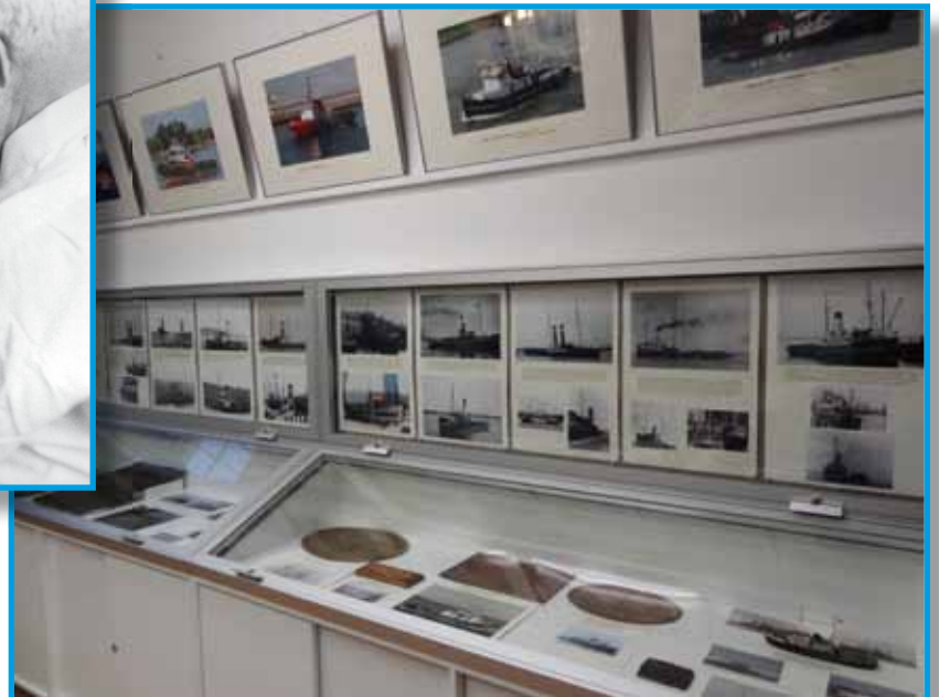
Links de oude opstelling met de tafel en rechts de nieuwe opstelling met de vitrinekast met daarop de fotovitrine zoals die in 2008 gereed kwam. Tevens werden de fotoplatten aan de wanden vervangen door platte fotovitrines.