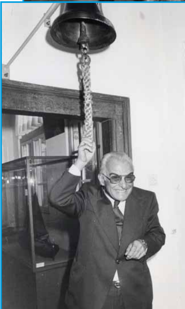
De tentoonstelling werd geopend door de Zwitserse consul-generaal dhr. M. Kissling.