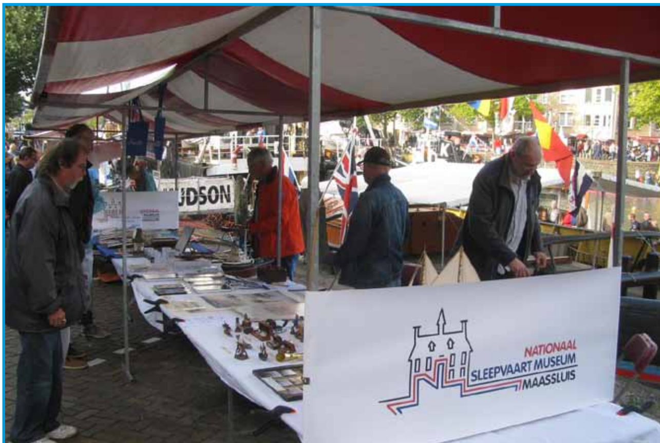
Tijdens de Furiade met de kraam aan de Haven

Tijdens de Wereldhavendagen in Rotterdam en de Furiade en de Sleepboothavendag in Maassluis is het Museum met een of meerdere kramen aanwezig. Doel is bekendheid te geven aan ons Museum en tevens om diverse nautische artikelen en -boeken te verkopen, om zo de financiën op peil te kunnen houden. Ook hopen we op deze dagen contact te kunnen leggen met eventuele nieuwe vrijwilligers voor ons museum.