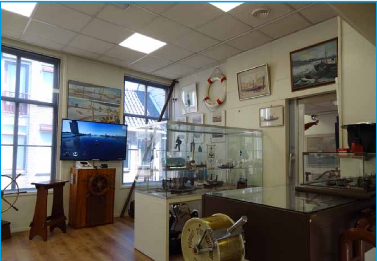
Ook de Rijnvaartzaal onderging in 2018 een opfrisbeurt