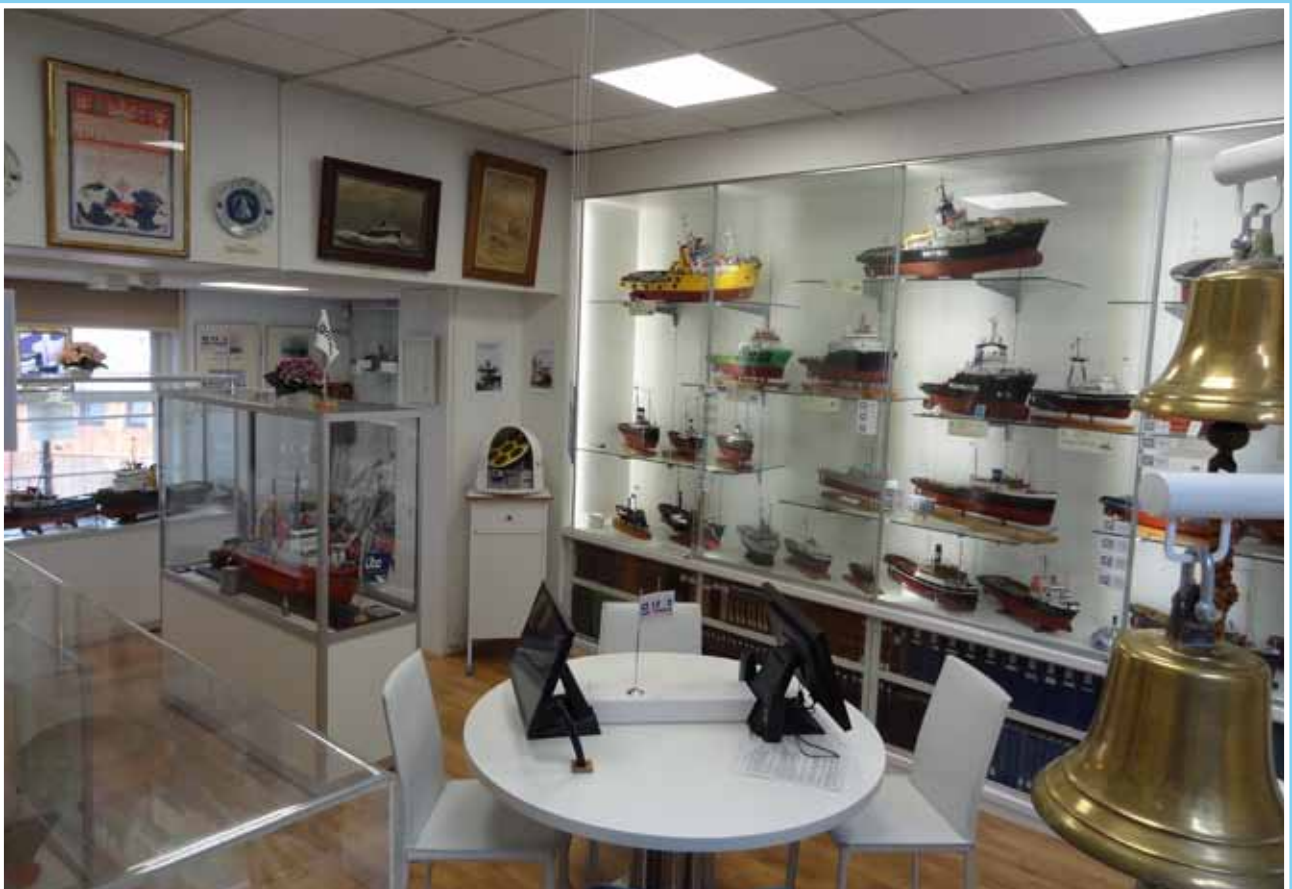
Op de foto boven de Zeezaal voor de verbouwing en onder het uiteindelijke resultaat in 2013