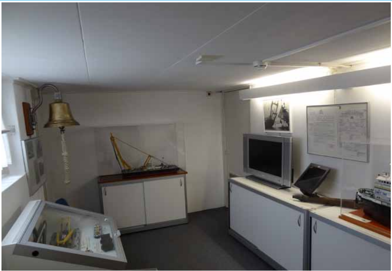
In de Bergingszaal werden in 2011 de onderkasten vervangen door nieuwe exemplaren. Gelijktijdig werden er in de Zeezaal en het trappenhuis enkele kleine vitrinekasten vervangen