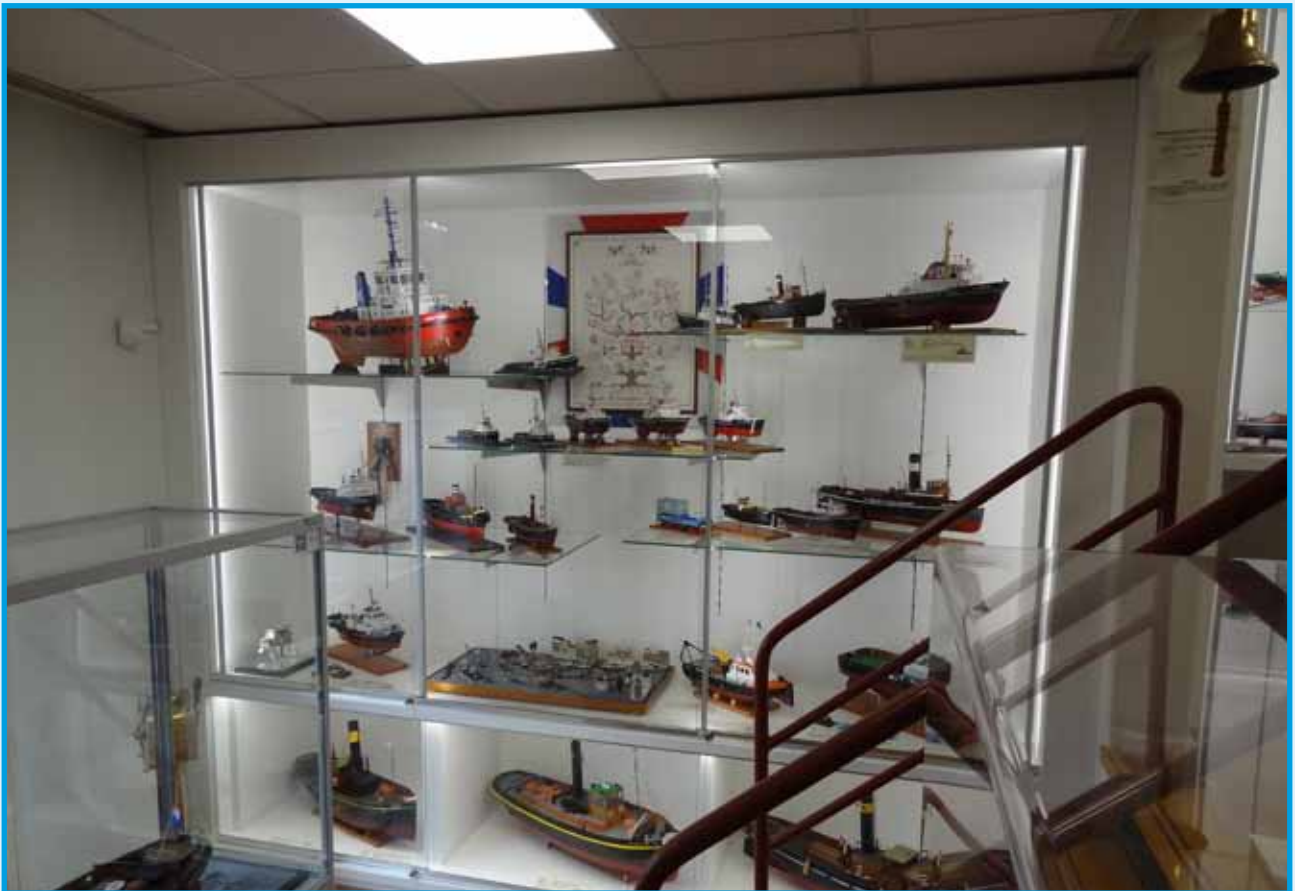
De oude opstelling in de Havenzaal (boven). De Havenzaal na de aanpassingen in 2018 (onder)